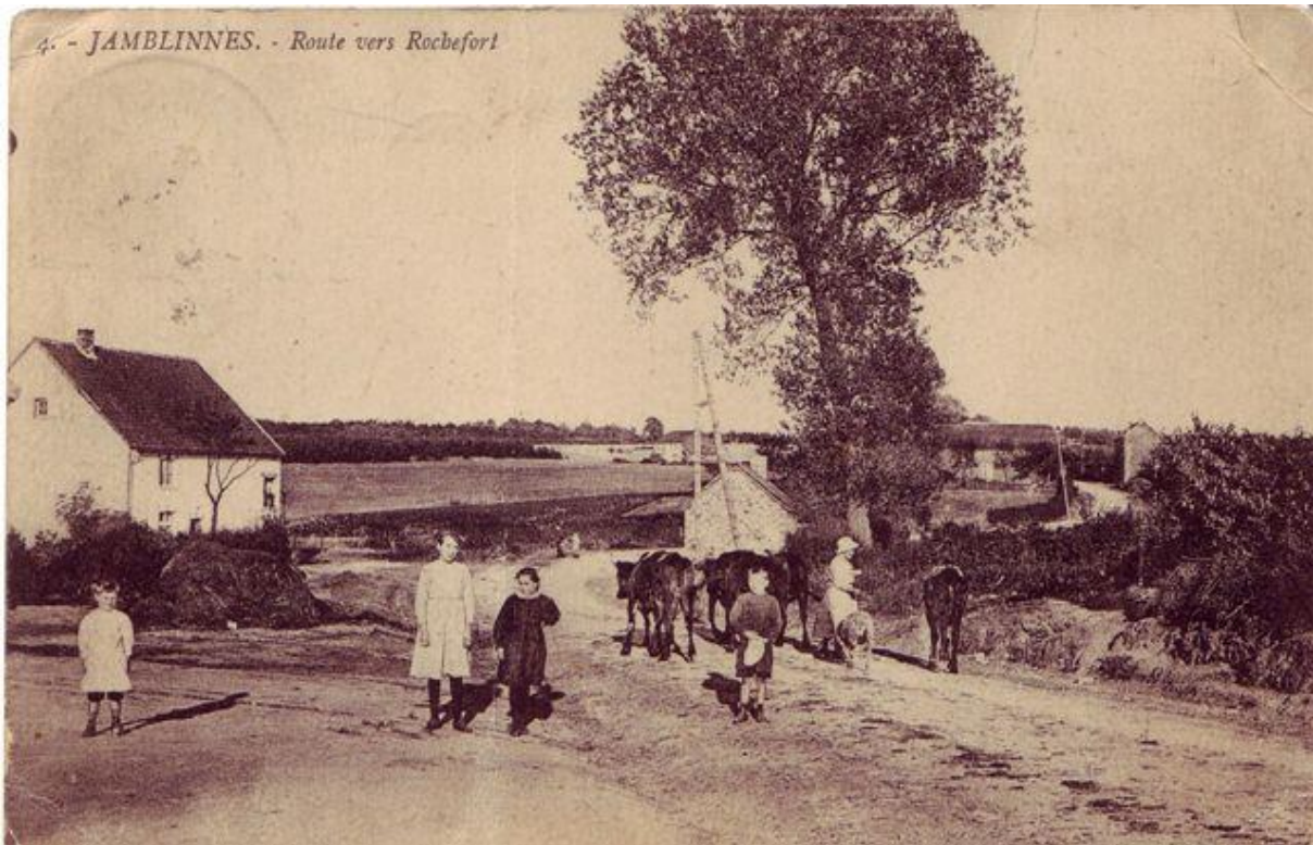
Image bucolique datant de 1911.